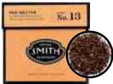
No.13 Red Nectar

레드 넥타(루이보스) 루이보스, 허니부쉬와 천연 과일향이 어우러져 살짝 달콤함