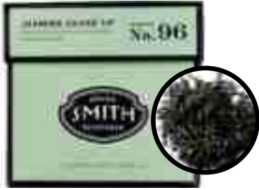
No.96 Jasmine Silver Tip