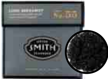
No.55 Lord Bergamot

로드 버가모트 한층 업그레이드 된 버가모트 향의 얼그레이 티 스리랑카의 딤블라, 우바와 인도 아삼에서 선별한 찻잎