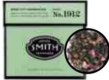
No.1912 Rose City Genmaicha

로즈시티 겐마이차 푹푹한 녹차에, 고소한 현미와 향기로운 장미가 더해진 스미스티만의 겐마이차