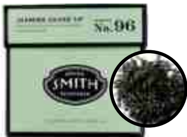
No.96 Jasmine Silver Tip