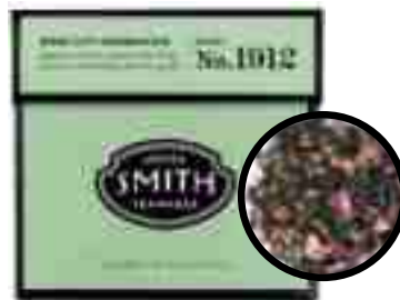
No.1912 Rose City Genmaicha

로즈시티 겐마이차 푹푹한 녹차에, 고소한 현미와 향기로운 장미가 더해진 스미스티만의 겐마이차