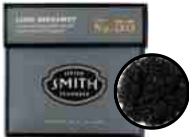
No.55 Lord Bergamot

로드 버가모트 한층 업그레이드 된 버가모트 향의 얼그레이 티 스리랑카의 딤블라, 우바와 인도 아삼에서 선별한 찻잎