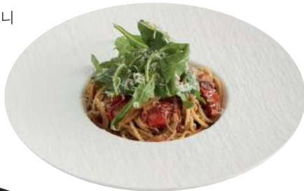
스파이시 앤초비 오일 스파게티