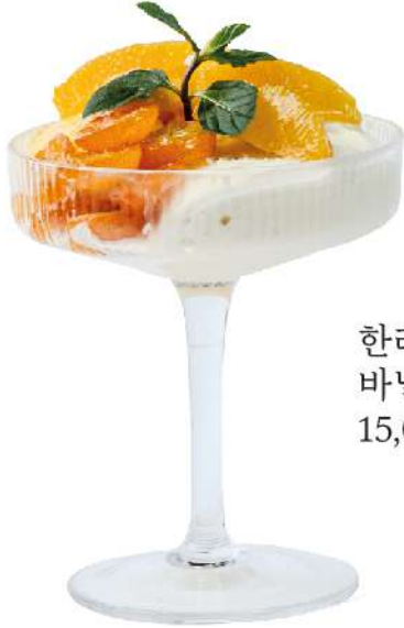
한라봉, 바닐라아이스크림 15,0