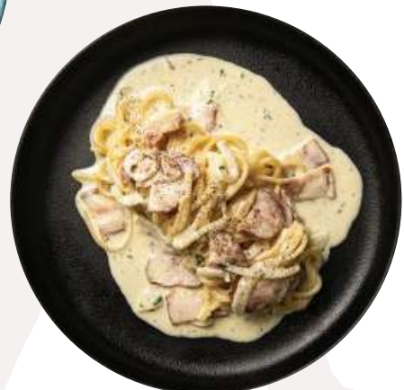
흑후추 베이컨 크림 파스타

10%의 세금과 10%의 봉사료가 포함된 금액입니다. All prices are inclusive of 10% service charge and 10% tax.