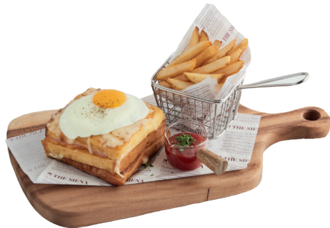
크로크마담 샌드위치 (Only lunch)