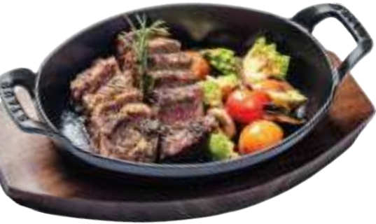
진갈비 살 로스트 비프, 계절야채