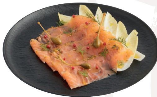
그라브락스 연어, 앤다이브