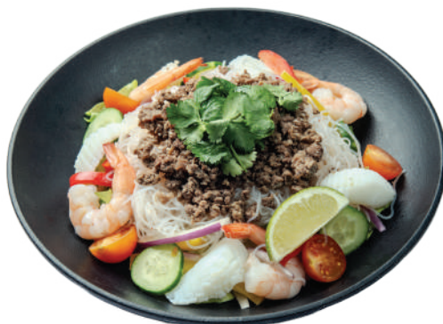
타이 스타일 칠리 글라스 누들 샐러드