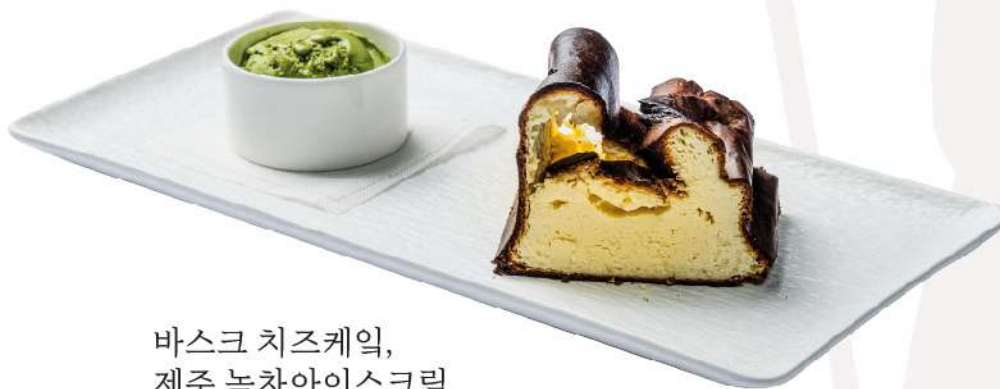
바스크 치즈케익, 제주 녹차아이스크림 21,0