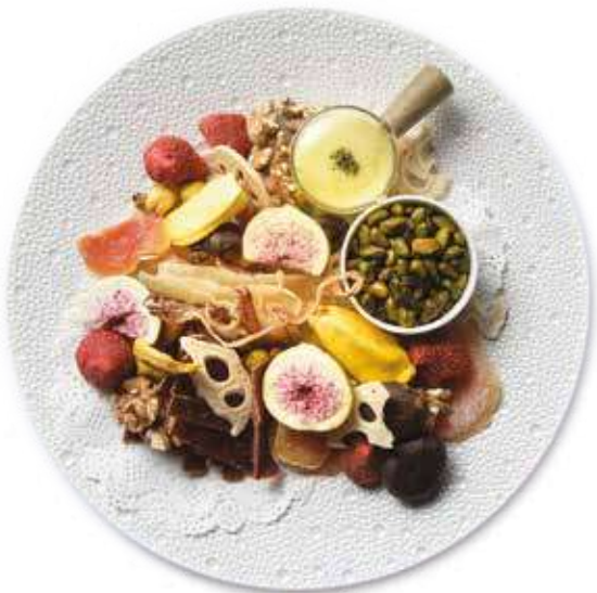
육포, 한치, 견과류를 곁들인 마른안주