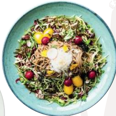
차가운 제주 메밀 소바