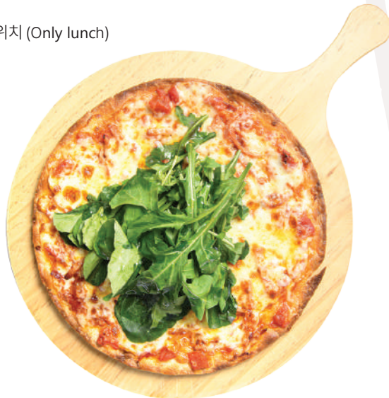
3 Ham, 3 Cheese Pizza