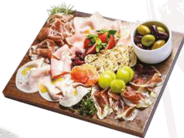
샤퀴테리 즉석 슬라이스