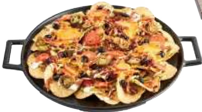
과카몰레, 사워크림을 곁들인, 더블 치즈 나초