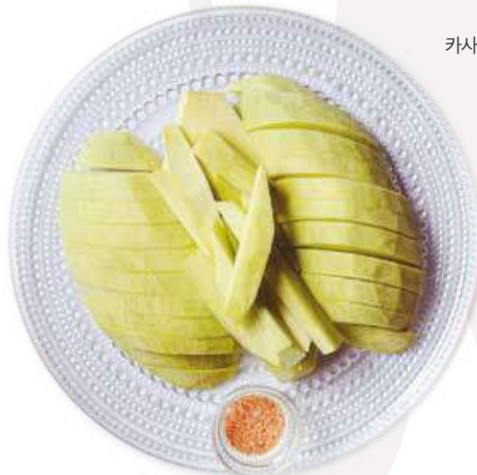
그린망고, 칠리 파우더 솔트