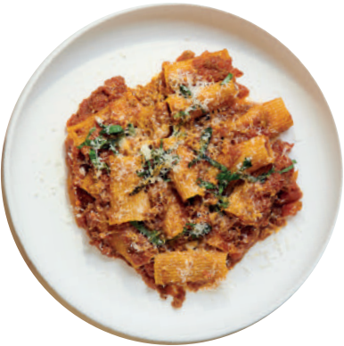
한우 라구 소스 리가토니