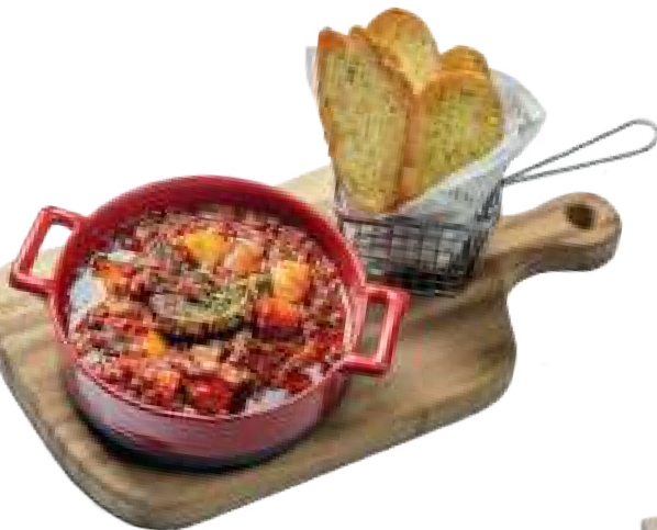
토스카나 스타일 아롱사태 스투 + 마늘빵 바스켓

알싸한 마라 치킨 wings과 고추부각 (17:00~22:00) 37,000