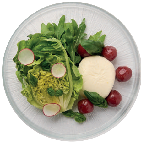
부라타치즈, 보석토마토, 직영농장 샐러드