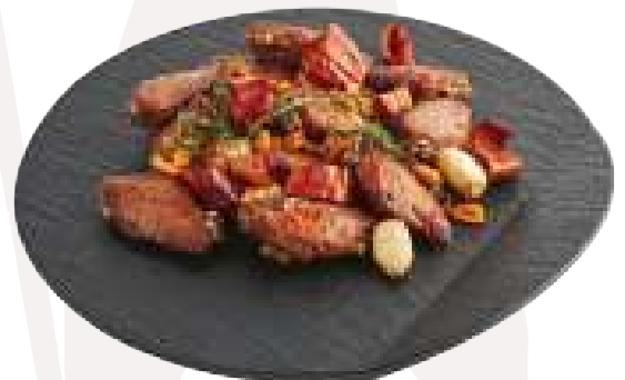
알싸한 마라 치킨 wings과 고추부각(Only dinner)