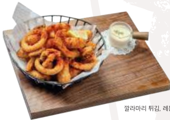
깔라마리 튀김, 레몬 크림 소스