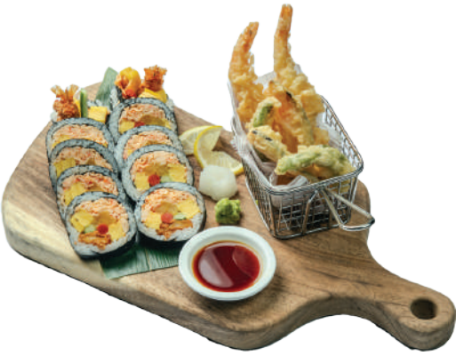
후또마끼 + 새우튀김 세트 (Only lunch)