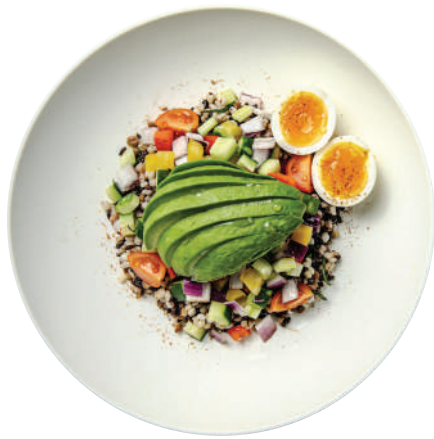
지중해식 4가지 곡물 건강 샐러드 (Only lunch)