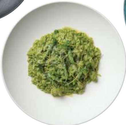
그린 아스파라거스 새우 리조 파스타