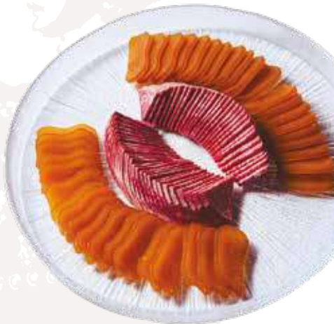
카사노바 보타르가(70g), 무 슬라이스