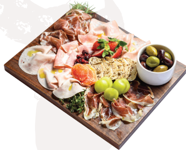
샤퀴테리 즉석 슬라이스