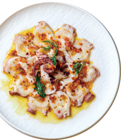
시칠리아식 포항문어, 야채 절임