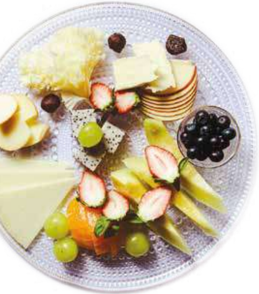
치즈 & 과일 플래터